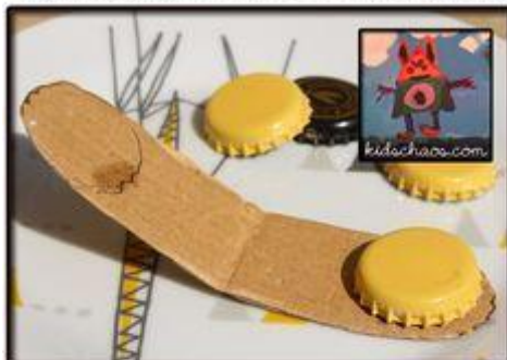
Beer bottle lids - Castanets

Mam dla Was jeszcze jedną propozycję- to kastaniety.