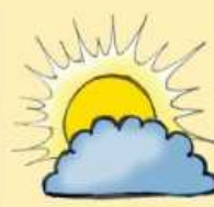
słońce za chmurą