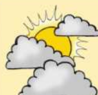
słońce za chmurami