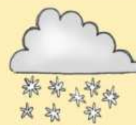
chmura ze śniegiem