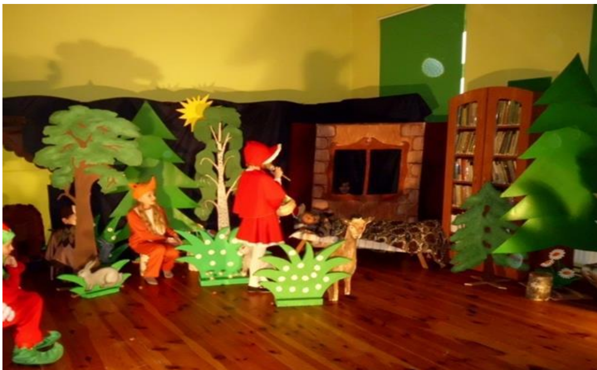
( Czerwony Kapturek)