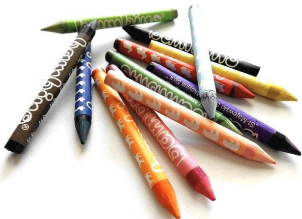
KRED - KI

Jak nazywają się przedmioty pokazane na zdjęciach? Podzielcie nazwy tych przedmiotów na sylaby. Poszukajcie w domu podobnych przedmiotów. Jak one rysują/malują? Sprawdźcie!