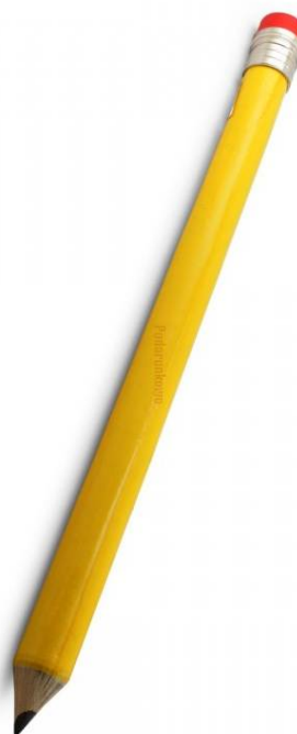
O - ŁÓ - WEK