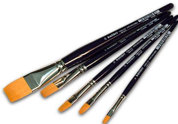
PĘDZ - LE