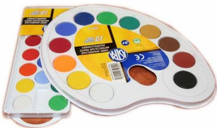
FAR - BY