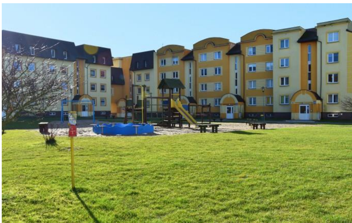
PODWÓRKO NA OSIEDLU MIESZKANIOWYM

Jest to plac przed domem, w którym się mieszka, najczęściej ogrodzony. Spójrzcie na ilustracje: